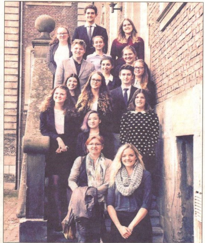
Die Teilnehmer und Lehrer des Hankensbütteler Gymnasiums beim MEP 2015 im niederländischen Kerkrade.